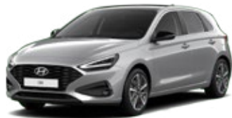
Shimmering Silver Metallic Metalická Cena: 16 900 Kč