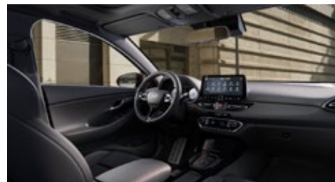
Černý interiér N line – látkové čalounění s červeným prošíváním a logem N – černé čalounění stropu a obložení bočních sloupků – červeně prošívavý sportovní volant, hlavice řadící páky a loketní opěrka