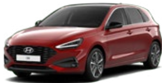
Ultimate Red Metallic Metalická Cena: 16 900 Kč