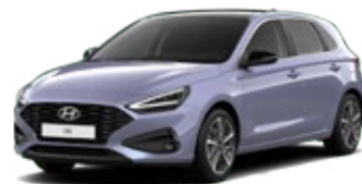
Meta Blue Pearl Perleťová Cena: 16 900 Kč