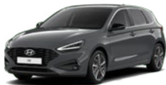
Ecotronic Gray Pearl Perleťová Cena: 16 900 Kč