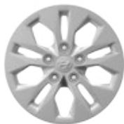
15" ocelová kola s celoplošnými kryty