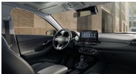
Černý interiér Oceanidis Black – látkové čalounění sedadel – světlé čalounění stropu a obložení bočních sloupků – černé provedení přístrojové desky a výplní dveří