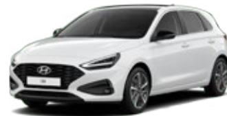
Serenity White Pearl Perleťová Cena: 16 900 Kč