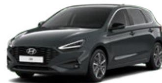
Cypress Green Pearl Perleťová Cena: 16 900 Kč