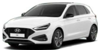
Atlas White Pastelová Cena: 5 900 Kč