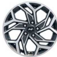
17" kola z lehké slitiny – N Line