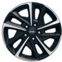
17" kola z lehké slitiny