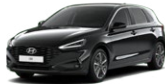
Abyss Black Pearl Perleťová Cena: 16 900 Kč