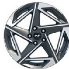
18" kola z lehké slitiny – N Line

* K dispozici pro vozy vyrobené do 9/2024.