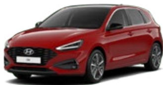
Engine Red Pastelová Cena: 0 Kč