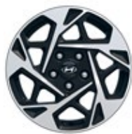
16" kola z lehké slitiny