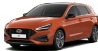
Jupiter Orange Metallic Metalická Cena: 16 900 Kč