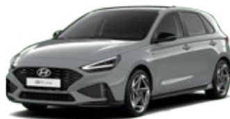
Shadow Gray Pastelová Cena: 16 900 Kč Dostupná pouze pro výbavy N Line