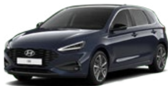
Sailing Blue Pearl Perleťová Cena: 16 900 Kč