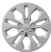
15" ocelová kola s celoplošnými kryty